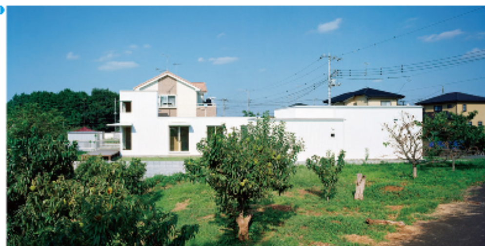
●仲里実「杜田帝岡設計工房」建築家紹介センター主催。

建築家に直接会うこともなく、ユーザーの身元を明らかにすることもなく、ネットの書き込みだけで、20人以上の建築家に無料で近い価格で平面図、立面図、断面図、さらに模型の提出を要求すること自体、ものづくりの本質から外れています(松津基司) 創作工房。建築家の登録条件は、「設計・監理専業の建築士事務所」にこだわり、これまでに1445名の応募者に建築家を紹介してきました。コンペ方式は建築家にかかる負担が大きいため行いません