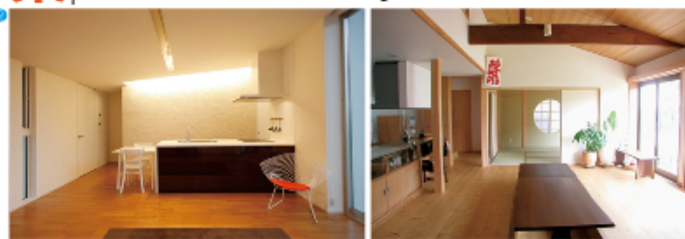
●「日高の家」設計＝一般建築士事務所建築企画 ●「つづまれた家」設計＝自働建築設計事務所 ●「遠瀬の家」設計＝米戸建築工房